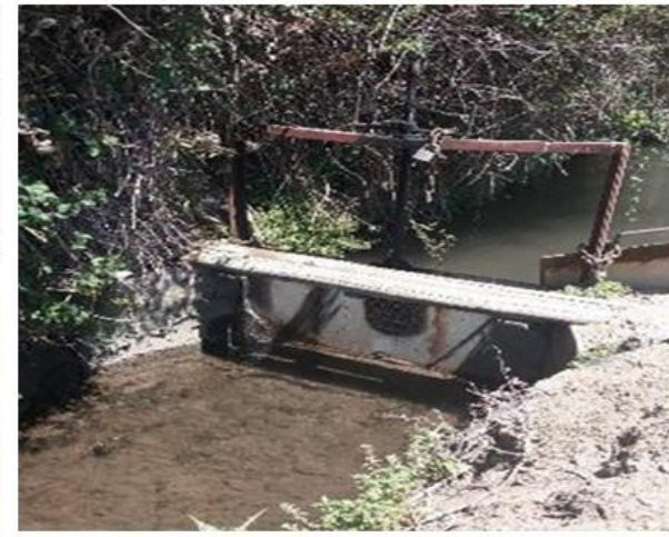
Foto 3. Canal Purehue.