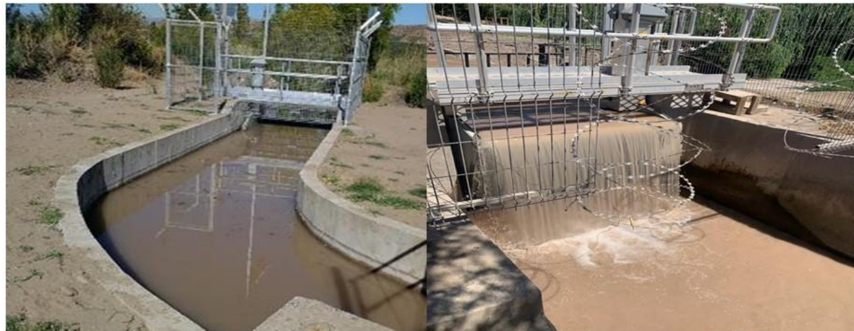
Foto 1. Canal Santa Rosa.