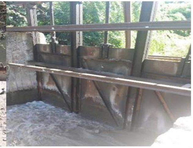
Foto 4. Canal Comunero.