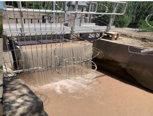
Foto 2. Canal Montenegro.